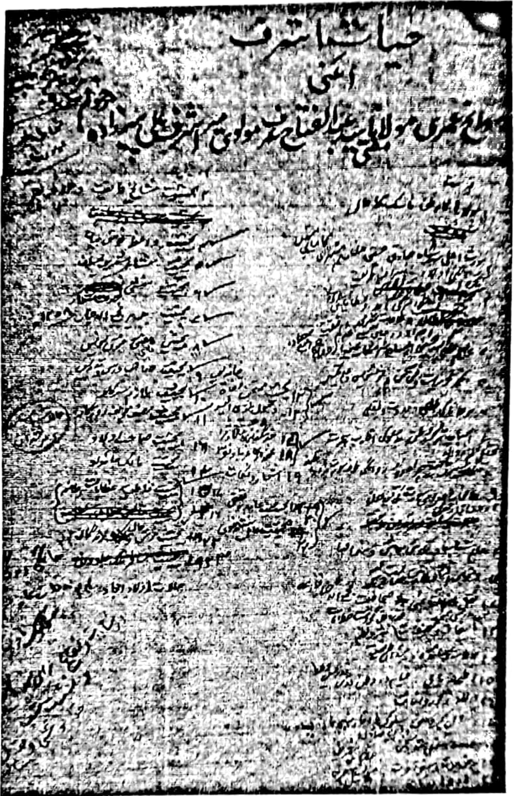
اقامی 'حیات اشرف' مفتی عبدالفتاح پیرزادہ گلشن آبادی کے سرورق و فہرست کا عکس